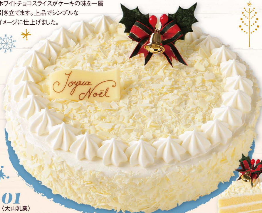
01 〈大山乳業〉 スノーブレイク (21cm)

●消費期限:お渡し日+1日(23日~25日は12/25期限日) ●お渡し期間:12/10~25