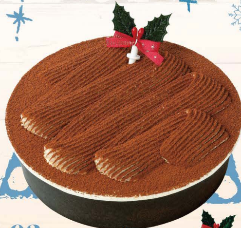
02 自家製クリームチーズ入りティラミスクリームをたっぷり使用。 〈大山乳業〉 ティラミス (約15cm)

●消費期限:お渡し日+1日(23日~25日は12/25期限日) ●お渡し期間:12/10~25